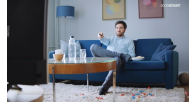
SodaStream TV-Spot „Modern Life“ – großes Kino für ein neues Zeitalter!