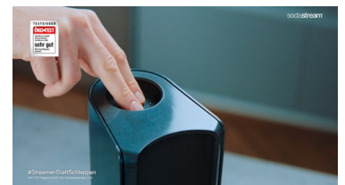
Mit dem TV-Spot sollen Verbraucher:innen darin bestärkt werden, sich vom Schleppen zu befreien und mit dem Streamen zu beginnen.